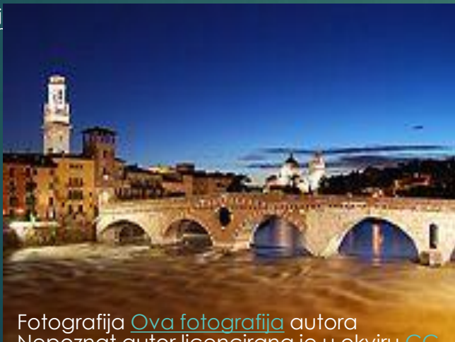
Fotografija Ova fotografija autora Nepoznat autor licencirana je u okviru CC BY-SA .