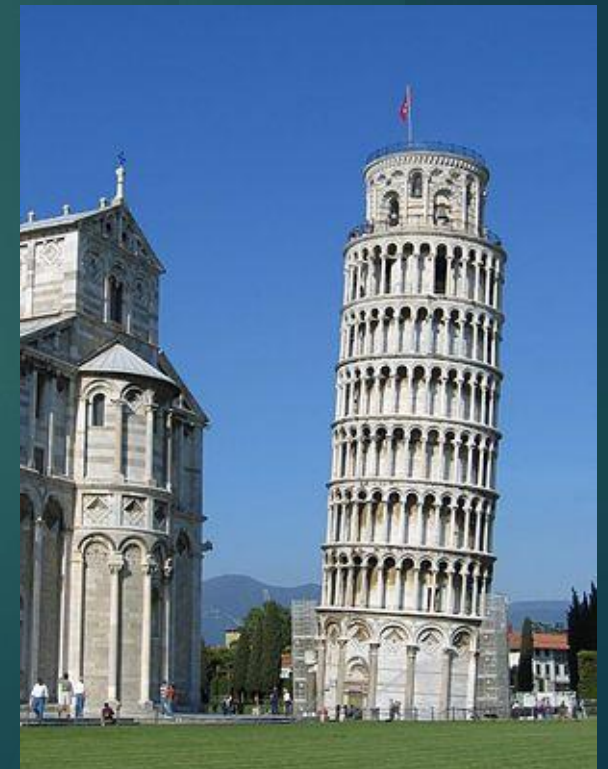
Fotografija Ova fotografija autora Nepoznat autor licencirana je u okviru CC BY-SA .